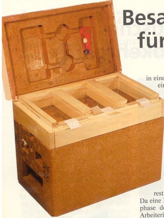
Apidea-Kästchen mit 3-gliedrigem Besamungs-Holzaufsatz.